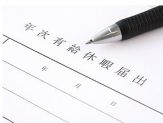
年次有給休暇取得義務