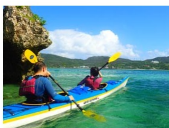
リフレッシュ休暇